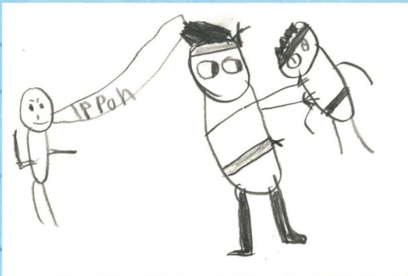
Harrastan Nääshallissa judoa.

Olen 10-vuotias. Tulin Suomeen noin 4-vuotiaana Tsetseniasta. Tykkään Suomen luonnosta ja kaikista eläimistä, paitsi joistakin ötököistä. Aion tulla palomieheksi. Aion ostaa omakotitalon ehkä Norjasta.